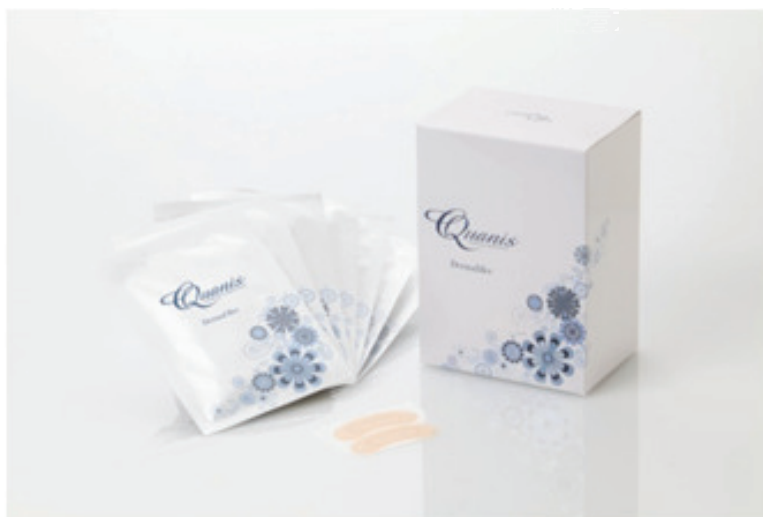
自社ブランド化粧品“Quanis Dermafiller”

2008年の商品化後、2011年春に株式会社資生堂から医科向けの化粧品として同社製品が発売され、同年11月には当該製品がIFSCC（国際化粧品技術者会連盟）Conference 2011 Bangkokにおいて最優秀賞を受賞しました。さらに、今秋には待望の自社ブランド化粧品“Quanis Dermafiller”の販売もスタートし、売上は右肩上がりです。