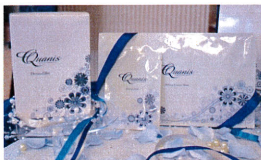
左：ダーマフィラー 8セット入（左右2枚×8セット）13,165円 右：メルティングエッセンスマスク 4枚入 8,640円

コスメディ製薬が展開するスキンケアブランド「クオニス」は、世界で初めて「溶解型マイクロニードル技術」を応用して開発されたシート状化粧品「ダーマフィラー」を発売中です。