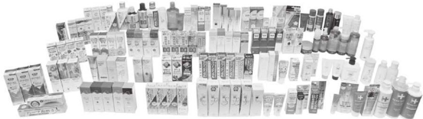
一般消費者に認知度の高い実績品の数々が並ぶ

また、豊富な研究知見や実績、特にスクラブ技術を応用した独自のスキんケア商品の展開にも注力している。昨年9月、誕生から5周年の節目に全面リニューアルした「ヘパトリート」など、多くのファンを持つブランドの新展開にも流通関係者から期待が集まっている。